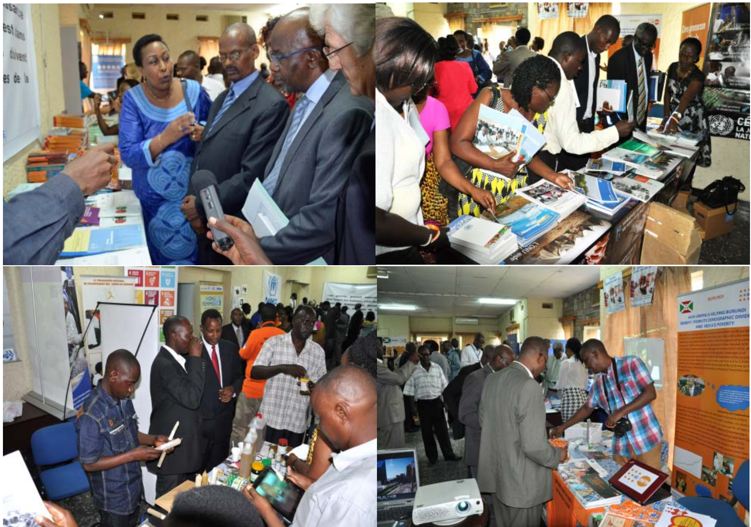
Les agences de l'ONU ont tenu des stands d'exposition sur le travail de l'organisation

Ce bulletin est produit par le Groupe Intégré de Communication (GIC) du Systèmes des Nations Unies au Burundi et édité et publié en ligne par le Centre d'Information des Nations Unies pour le Burundi.