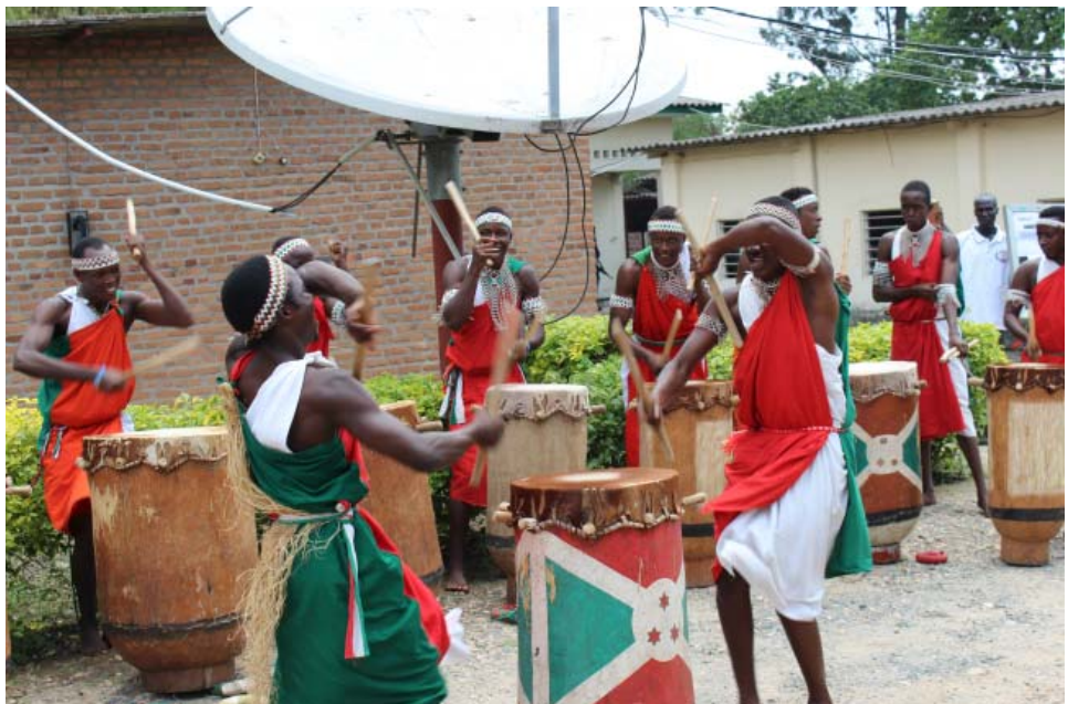
Tambour burundais à l’occasion de la Journée des Nations Unies

Depuis le lancement de ce programme, le Programme Alimentaire Mondial a déjà acheté auprès de ces producteurs 2.543 tonnes de haricots pour une valeur de plus de 1.400.000 dollars américains et 1.574 tonnes de riz et de maïs pour une valeur de plus de 800.000 dollars. Le marché ainsi créé incite les agriculteurs locaux à produire plus de denrées qui sont écoulées sur le marché et en partie achetées par le PAM pour être utilisées dans