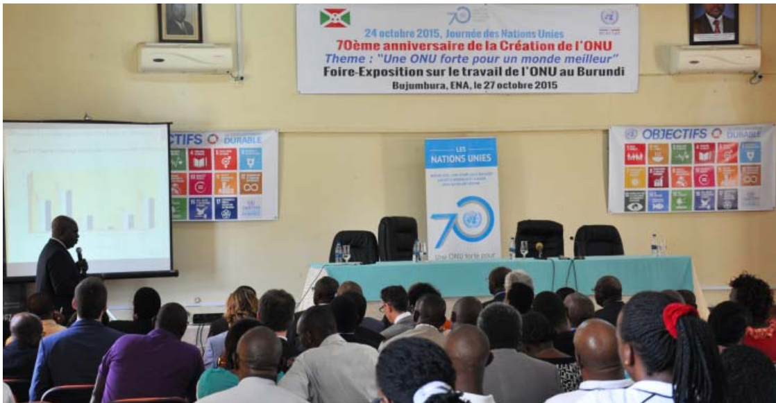
Présentation sur les ODD