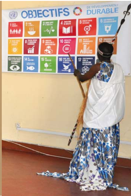
Poème en Kirundi sur l'histoire et les réalisations des Nations Unies au Burundi