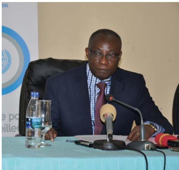
Allocution de l'Assistant du Ministre des Relations Extérieures représentant le gouvernement dans cette commémoration.