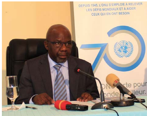
Le Coordinateur résident prononçant le discours de circonstance