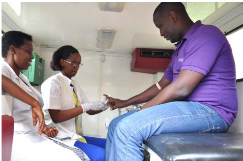
Dépistage volontaire du VIH, une autre activité organisée à l'occasion du 70ème anniversaire de l'ONU