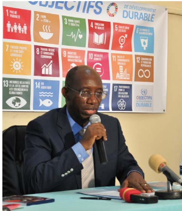
Discours du Président de la Fédération des Associations du Personnel des Nations Unies

Présente au Burundi depuis 1963, l'Organisation Mondiale de la Santé apporte son appui dans la lutte contre les maladies transmissibles et non transmissibles, la promotion de la santé tout au long de la vie, le renforcement du système de santé, la préparation ainsi que la réponse en matière d'intervention sanitaire dans les situations de crise et d'urgence.