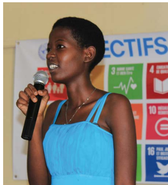
Une élève de talent a rédigé un slam sur les Nations Unies et l'a déclamé lors de la commémoration des Nations Unies.

matière agricole. Le "Programme de Développement des Filières"(PRODEFI) sera mis en œuvre par phases successives dans 7 provinces. Il a bénéficié de la part du FIDA, à partir de mai 2013, d'un financement d'une nouvelle composante «Emplois des jeunes ruraux». Le "Projet pour Accélérer l'atteinte de l'ODD-1" (PROPA-O), qui vise à réduire de moitié, entre 1990 et 2015, la proportion de la population qui souffre de la faim, est entré en vigueur depuis